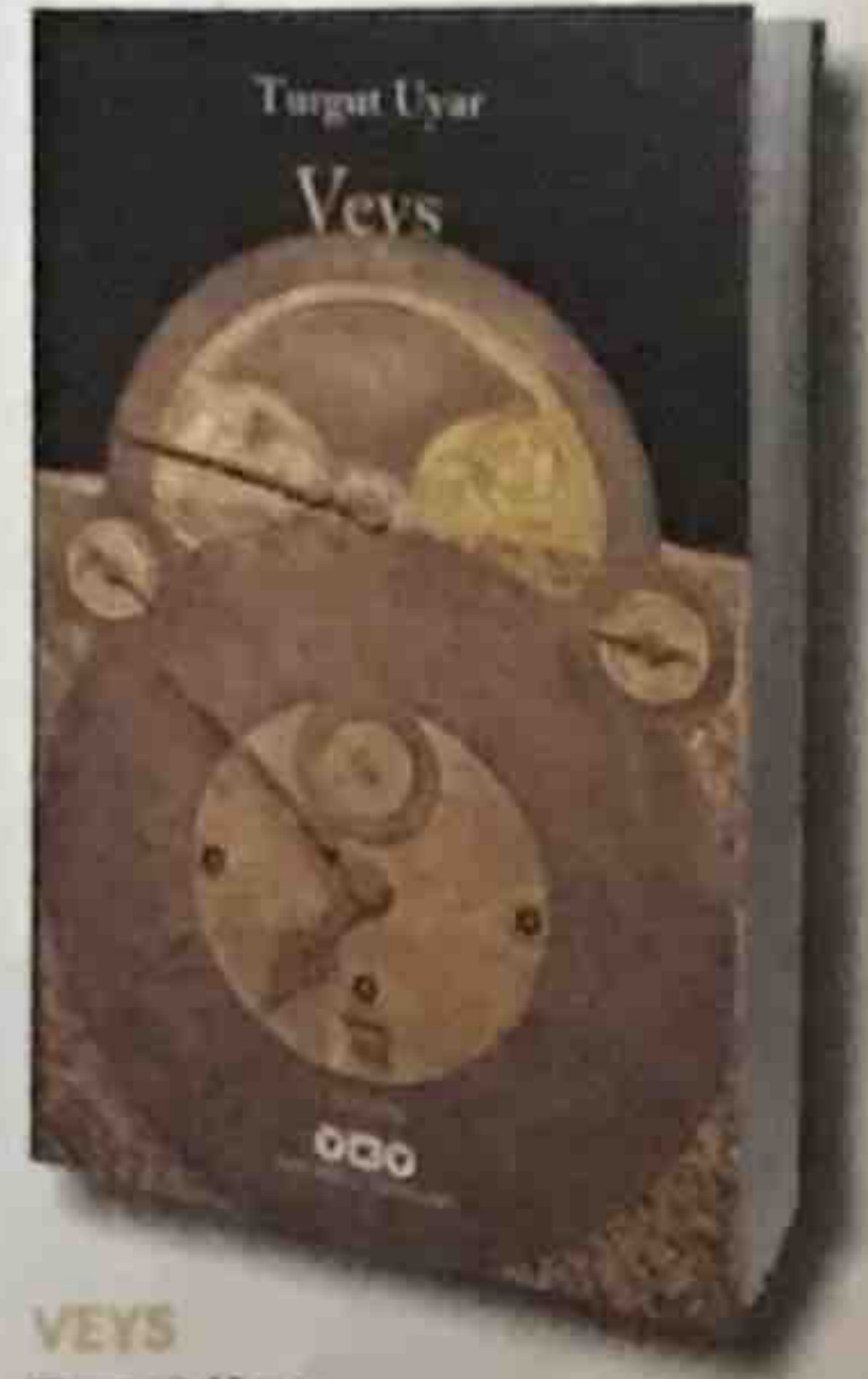
VEYS Turgut Uyar YKY

Dikkati çeken diğer bir unsur, sık sık trafik ışıklarının kırmızı, yeşil ve sarı renklerde yanarak kahramanın ruh hallerine uygun bir şekilde hareket etmeleri